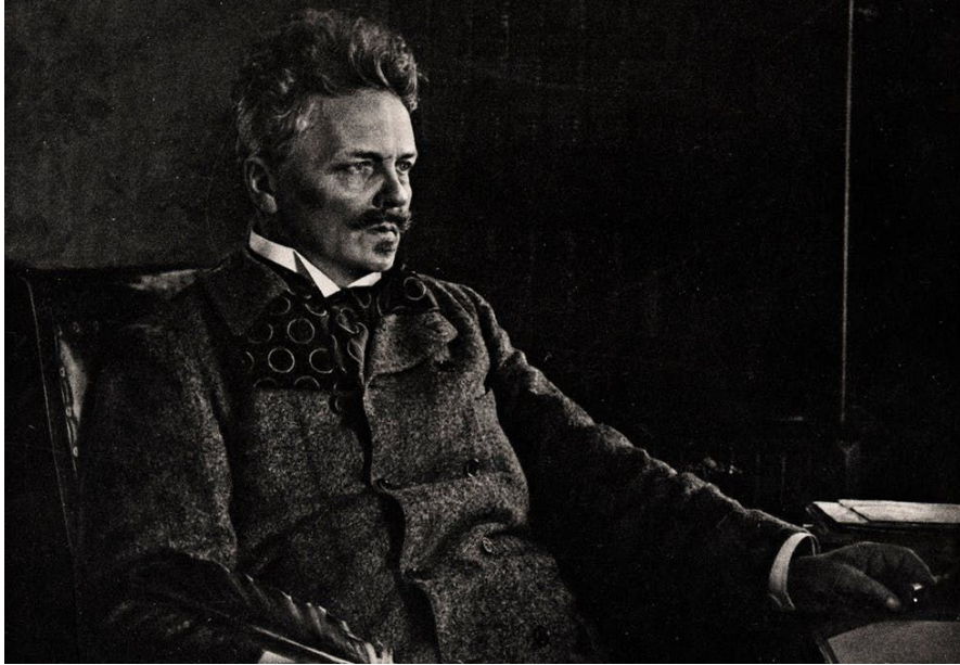
August Strindberg fotograferad 1902.