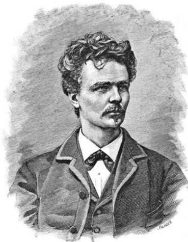
En gravyr av en ung August Strindberg.

Den mörka synen på familjen som institution förstärktes av moderns död 1862, och faderns omgifte med familjens unga hushållerska, som snart blev den känslige tonåringens bittra fiende.