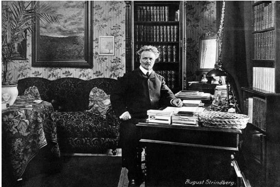
Strindberg fotograferad i sitt arbetsrum under sina sista år.

intryck, alltid klädd med oklanderlig elegans, och med en förmåga att väcka kvinnors och mäns varmaste sympati.